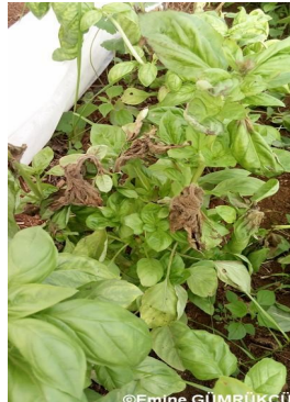
Resim 9. Fesleğende gri küf