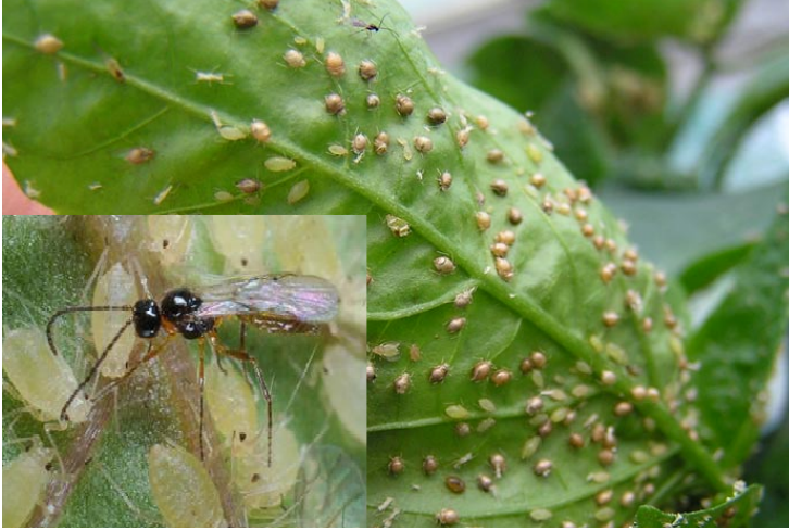
Resim 12. Parazitoit ve parazitlenmiş yaprakbitleri