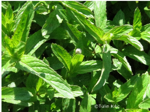
Resim 8. Nanede salyangoz

Tarla ve bahçelerde kültür bitkilerinin yaprak sürgün ve meyvelerini kemirmek suretiyle zararlı olur. Kemirdikleri yaprakların yalnızca damarları kalabilir. Popülasyon yoğunluklarına bağlı olarak ekonomik önemde zarar oluşturabilir (Resim 8). Yurdumuzun çok kurak bölgeleri dışında hemen her yerinde bulunur.