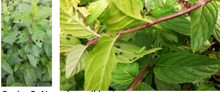
Resim 5. Nandede yeşil kurt zararı

Yeşil kurt larvası çok sayıda kültür bitkisiyle beslenen bir zararlıdır. Zararlıının beslendiği bitkiler arasında marul, nane, ıspanak, maydanoz, semizotu, roka, tere ve fesleğen de bulunur. Yeşil kurt yumurtalarının yapraklara bırakır ve yumurtadan çıkan larvalar yapraklarda beslenir. Yenilmiş kısımlar sararır ve kurur (Resim 5).