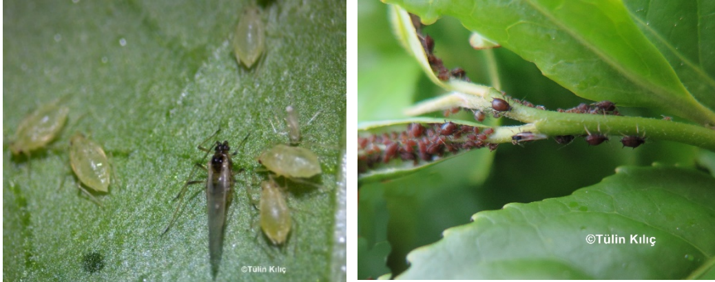
Resim 2. Yaprakbitleri ve oluřturdukları koloni

Yaprakbitlerinin vücudu oval ve yumuřak olup 1.5-3 mm boyundadır. Erginler çevre kořullarına göre kanatlı veya kanatsız olabilir (Resim 2). Bitki özsuuyula beslenirler. Beslenmeleri sırasında salgıladıkları toksik maddeler nedeniyle anormal büyüme yapraklarda kıvrılmalar ve řekil bozukluklarına neden olurlar. Genelde koloniler halinde yařarlar. Yaprakbiti yoğunluđu hava řartlarıyla çok ilgilidir. Kuraklık ve sıcaklık arttıđında, popülasyon birden düşer. Sera kořullarında ise çođalmasına devam eder yařamını ve zararını sürdürür.