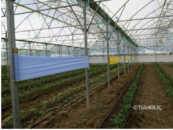
Resim 14. Seralarda rulo-şerit yapışkan tuzaklar.