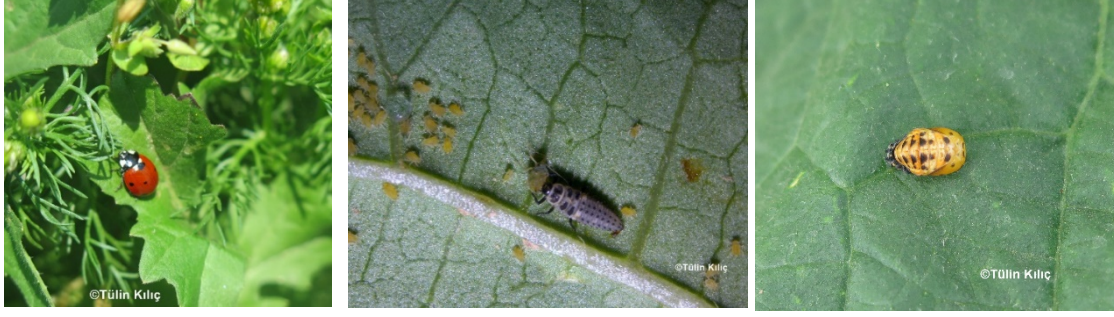
Resim 3. Uğur böceği ergini, larvası yaprakbiti ile beslenirken ve pupası