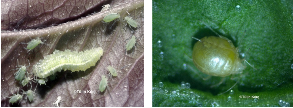
Resim 4. Syriphidae larvası yaprakbiti ile beslenirken, Parazitlenmiş yaprakbiti