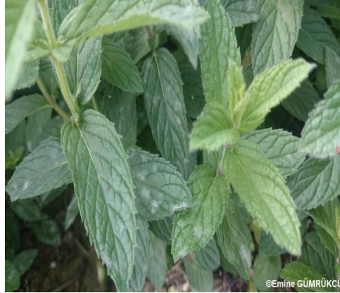
Resim 1. Nandede külleme hastalığı belirtileri