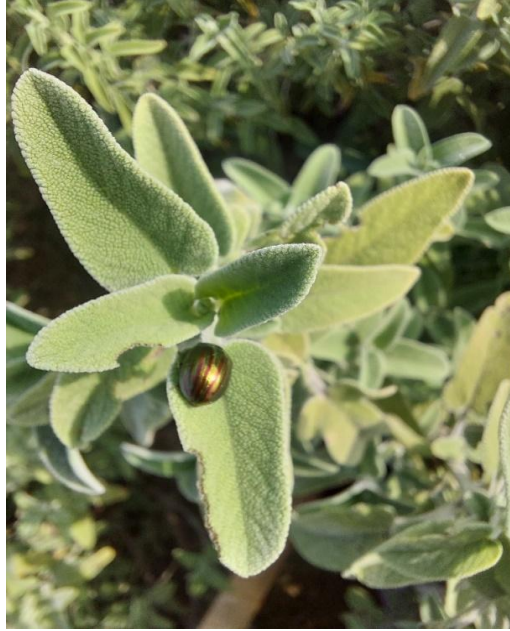
Resim 18. Adaçayında yaprak böceği ve zararı