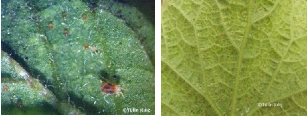
Resim 7. Kırmızı örümcek ve yumurtaları, yaprakta zararı, oluşturduğu ağlar