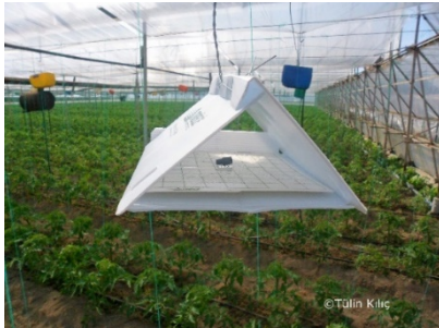
Resim 6. Eşeysel çekici feromon tuzak

Yeşil kurdun ergin çıkışını saptamak için dikimden hemen sonra izleme amaçlı eşeysel çekici feromon tuzaklar 1 tuzak/da kullanılır. Tuzaklar haftada bir kontrol edilir ve ilk ergin çıkışı belirlenir (Resim 6).