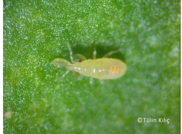
Resim 15. Orius ergini , nimfi tripsle beslenirken