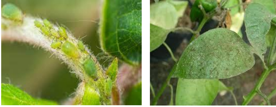
Resim 11. Yaprakbiti ve yaprakta zararı

Bitki özsuyunu emmesi sonucu yapraklar büzüşmüş, kıvrılmış bir görünüm alır. Bitki zayıflar, gelişme durur. Verim ve kalitesi bozulur. Bazı önemli virüs hastalıklarının vektörlüğünü de yaparlar. Salgıladıkları tatlı maddeler nedeniyle gelişen fumajin mantarları, özümleme ve solunuma engel olur (Resim 11). Açık sarı, yeşil, pembemsi kırmızı, siyah olmak üzere çeşitli renkleri vardır. Doğal düşmanları için bakınız; nane yaprak bitleri , Sayfa 5.