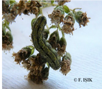
Resim 17. Kekikte yeşil kurt larva (solda) ve zararı (sağda)